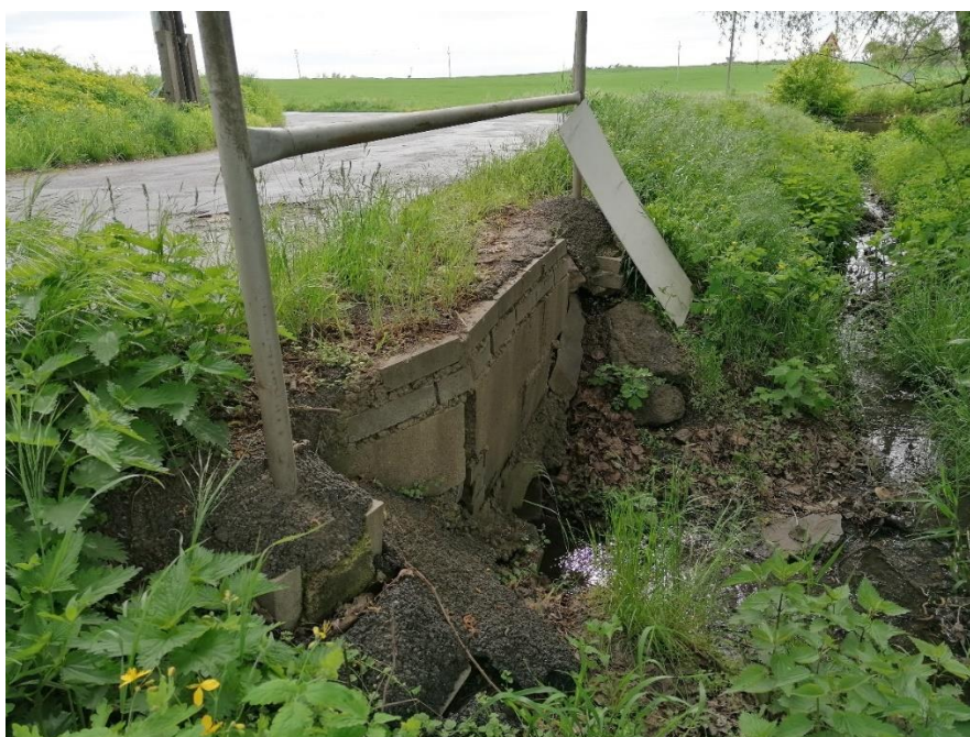
Pohled na výtok

Propustek je tvořen rozpadlými betonovými čely osazenými rezivělým zábradlím. V rámci opravy komunikace bude propustek obnoven formou ŽB trouby DN 600 délky 7,60m.